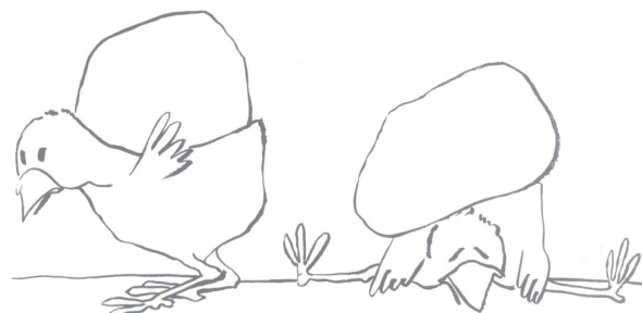
ill : E. Bruneel, Père Castor Flammarion

Il y a extension naturelle de la préoccupation des textes à celle de la langue écrite par laquelle ils ont été produits. Mais